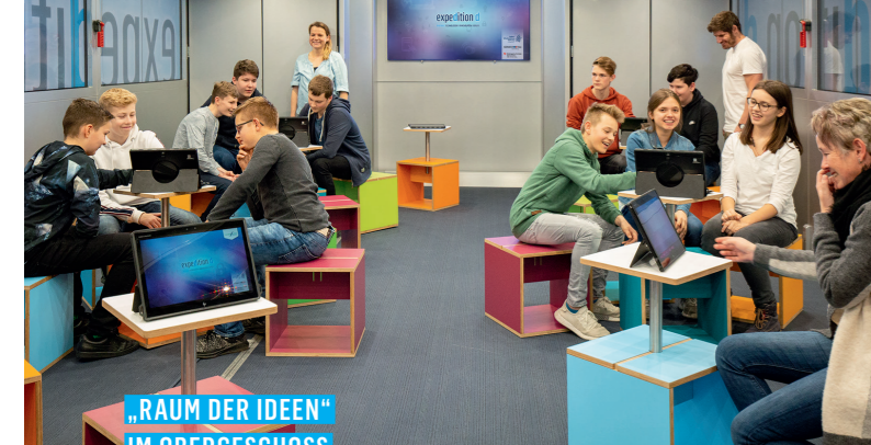
„RAUM DER IDEEN“ IM OBERGESCHOSS