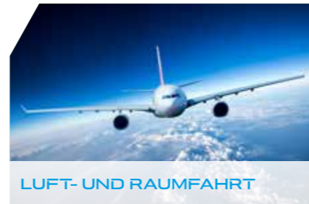
LUFT- UND RAUMFAHRT