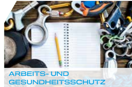
ARBEITS- UND GESUNDHEITSSCHUTZ