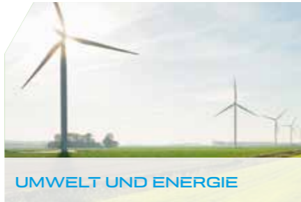
UMWELT UND ENERGIE